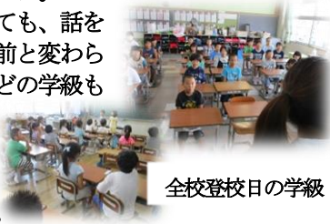
全校登校日の学級

どの学級へ行っても、話を聴く姿勢は休み前と変わらず、凛々しいほどの学級もありました。学びの第一歩、聴く姿勢が定着しつつあります。