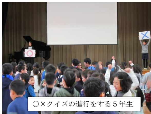
〇×クイズの進行をする5年生

ここまで成長できたのは、5年生の持ち前の「明るさと素直さ」があったからです。さて、4月からはよいよ最高学年となります。一人ひとりが背中に「徹明さくら小学校の初代6年生」の看板を背負っています。それぞれが自覚をもち、努力を続けなければなりません。「明るさと素直さ」に加え、「自分に対して甘えず、厳しい心」をもってがんばってほしいと思います。