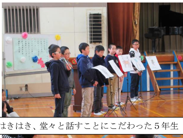
はきはき、堂々と話すことにこだわった5年生

生活面では、毎日、5年キャンペーンを成功させるためにみんなで意識して取り組み、一点突破で達成していくことを大切にしてきました。このように団結力を大事にして臨んだ6年生を送る会では、一人ひとりが役割をもち、会を企画・運営し、見事に会を成功させました。努力が認められ、やりがいを感じた瞬間でした。この送る会の成功によって、さらに自信をもつことができ、卒業式でのよびかけやピリブの歌を立派に発表して、心を伝えることができました。このような姿から、下級生に5年生の果たすべき役割を示すことができたのではないのでしょうか。